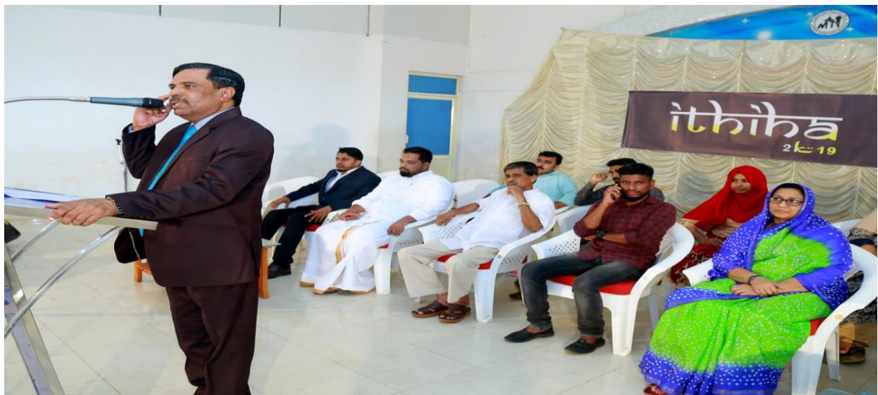
Justice P.Ubaid of Kerala High Court