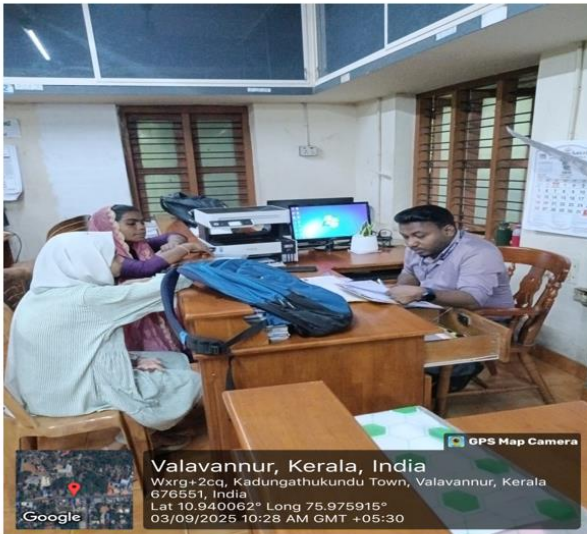
Valavannur, Kerala, India Wxrg+2cq, Kadungathukundu Town, Valavannur, Kerala 676551, India Lat 10.940062° Long 75.975915° 03/09/2025 10:28 AM GMT +05:30