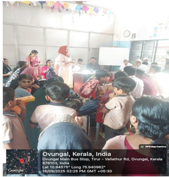
Ovungal, Kerala, India Ovungal Main Bus Stop, Tirur - Vailathur Rd, Ovungal, Kerala 676103, India Lat 10.94575° Long 75.940962° 16/09/2025 02:25 PM GMT +05:30