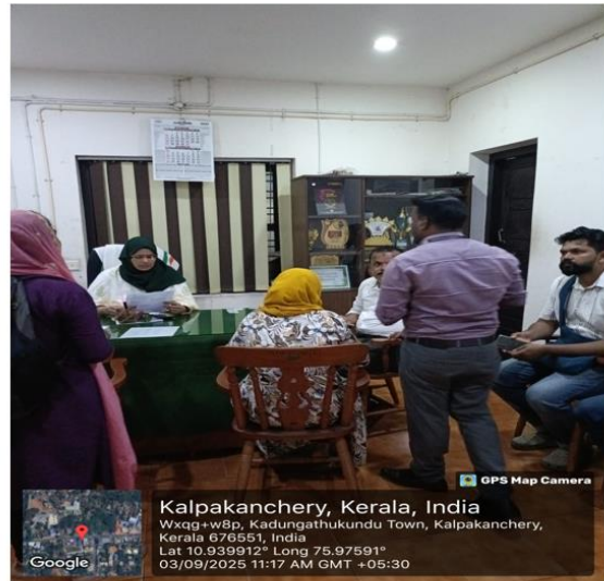
Kalpakanchery, Kerala, India Wxqg+w8p, Kadungathukundu Town, Kalpakanchery, Kerala 676551, India Lat 10.939912° Long 75.97591° 03/09/2025 11:17 AM GMT +05:30